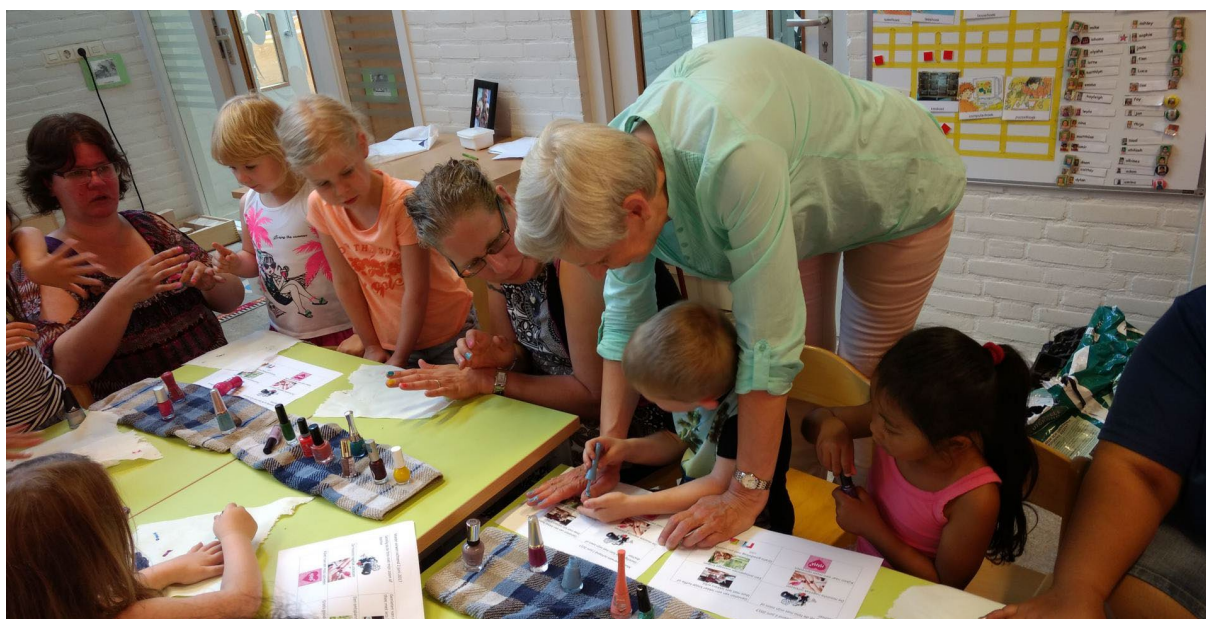
Moederverwendag bij de kleuters